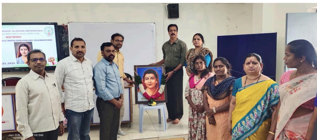
Principal and Staff garlanding the portrait of Savithri Bhai Phule

The celebration inspires everyone to follow her path of knowledge and empowerment.