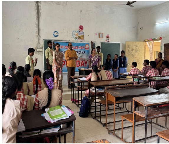
Vice Principal and staff motivating the junior college students