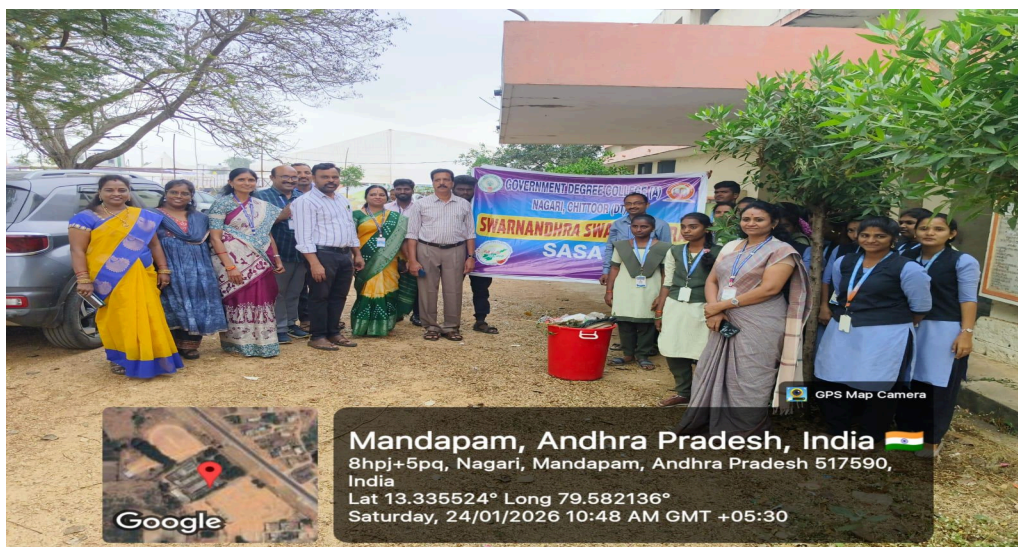
Principal, Staff and Students participating in the clean and green programme

Introduction: Government Degree College (A), Nagari, observed National Girl Child Day on 24th January 2026 with great enthusiasm and active participation from students and faculty. The event aimed to raise awareness about the rights, education, and empowerment of the girl child. A total of 51 students and 11 faculty members participated in the program.