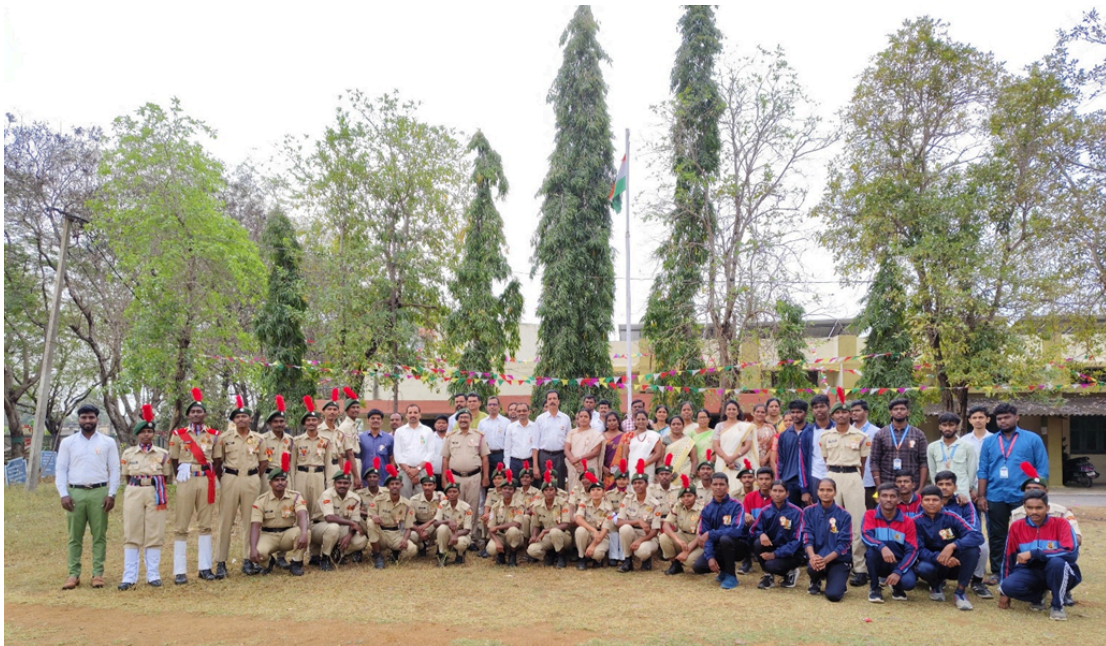
Staff and students with the Principal and Vice-Principal