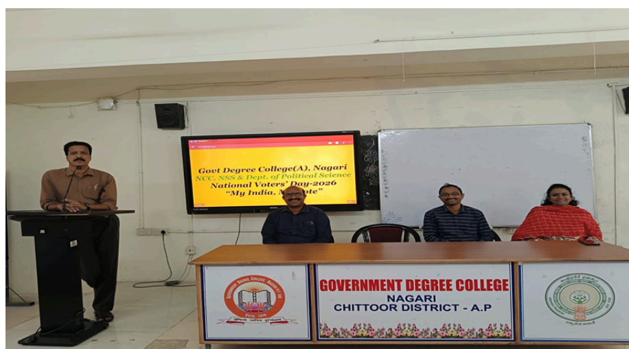
Address by the principal

The programme effectively promoted democratic awareness among students and encouraged them to become responsible and informed voters. The programme significantly contributed to nurturing active citizenship and strengthening democratic values among the youth.