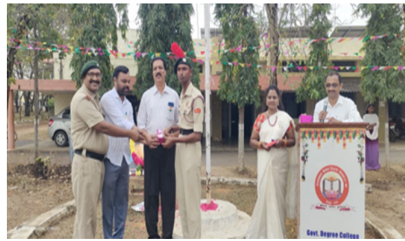
Prize Distribution on 26th January 2026