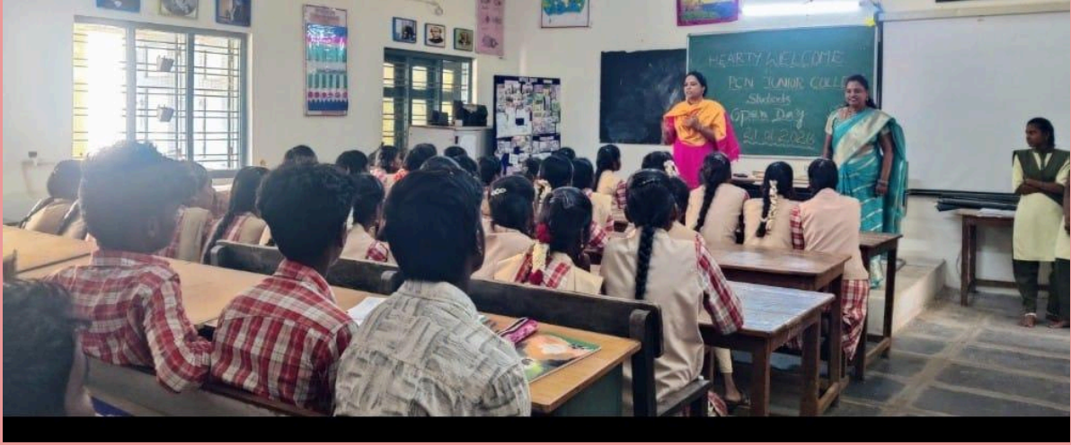
Junior college students visiting the departments in our campus on Open Day